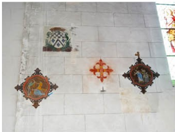
Saint Aubin sur Gaillon