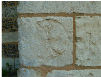
Le Tilleul Othon