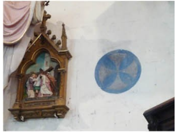
Le Tilleul Othon