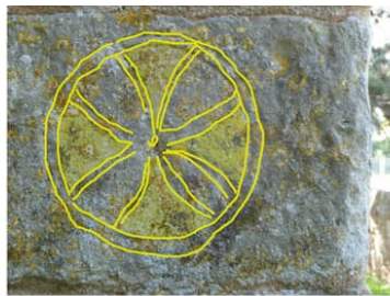
Le Tilleul Othon