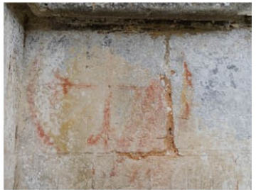
Tilleul Dame Agnès