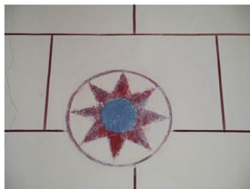
Thomer la Sogne