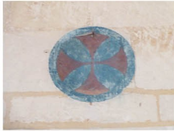
Le tilleul Othon