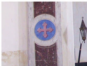
Gisay la Coudre