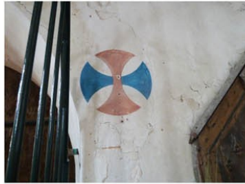
Illeville sur Montfort