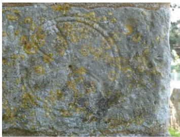
Le Tilleul Othon